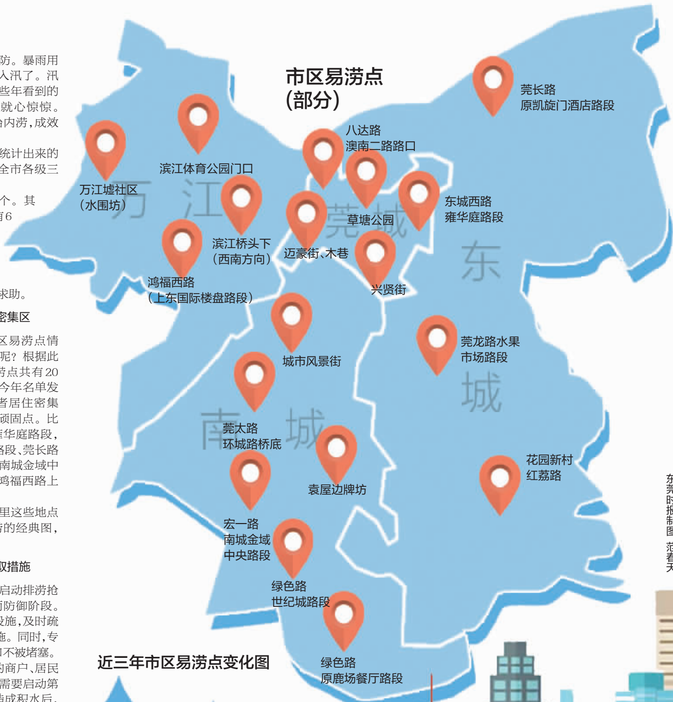
近三年市区易涝点变化图

工作人员还将向区域范围内的商户、居民等发出暴雨警报。如果暴雨持续，需要启动第二阶段的应急响应。首先是暴雨造成积水后，工作人员需打开内涝区域雨水篦子及检查井盖，加快排水。当积水深度在30至50公分，且暴雨持续，排涝应急抢险工作人员立即通知交警部门组织交通疏导。当积水深度在50至70公分，且暴雨持续，由街道办与公安部门统筹指挥受灾群众安全撤离或转移。当积水深度超过70公分，且暴雨持续，由街道办统筹调配冲锋舟、救生衣等物资，救援受灾群众。