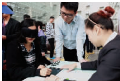
一位市民在活动现场戴上眼罩画画