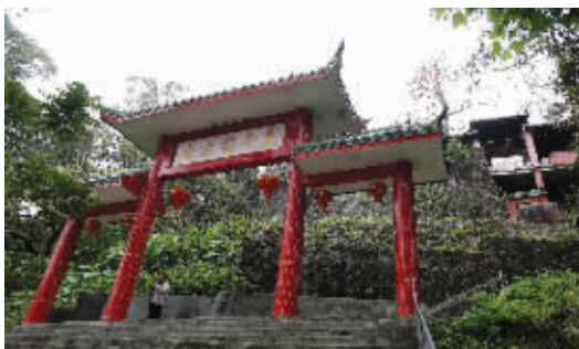
位于亭岗岭的亭岗古庙

解放前后，水路是东莞十分重要的交通运输方式，东莞的蔗糖、莞草等货物时常沿着东江发往惠州。而位于东坑镇的亭岗岭则是解放前水路的交通要道，当年尤为重要的税站、蔗站都会在此设点，方便过往客商纳税、交易。