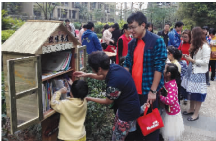
“朗味书屋”共享图书箱深受小区居民欢迎

“‘朗味书屋’对于我们小区居民来说肯定是好的，很多看完的书放在家里不知道如何处理，现在可以通过交换书本的方式与邻居分