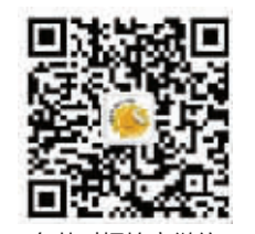
东莞时报拍客微信

朋友圈里的晒娃贴，你一定看过不少吧？想不想在报纸上晒娃？想不想时报记者为你家萌娃拍大片？来来来，我们开了一个晒娃专栏——“超级宝贝”！赶紧关注“东莞时报拍客”微信，给我们发一张你家萌宝的美照，我们的摄影记者很有可能跟你打电话，约你家宝宝一起玩耍，拍美美哒的大片！我们会在公众号同步展示，还等什么，赶紧扫描二维码约起来！