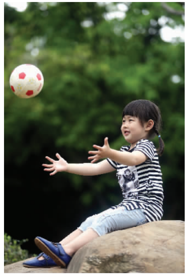
跟妈妈互动玩皮球，琪琪开心极了