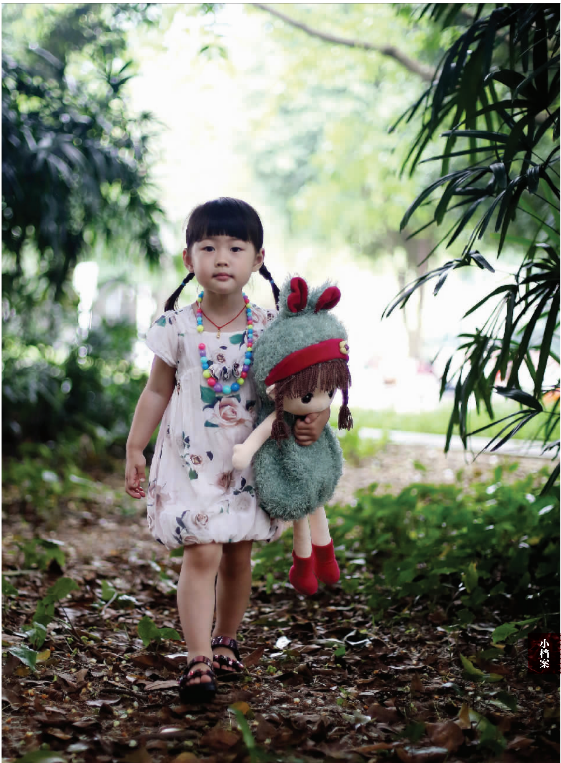
可爱的琪琪抱着娃娃大踏步往前走，超有范儿