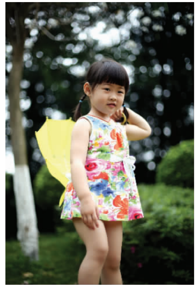
穿着花裙子，像透过树丛的一片阳光