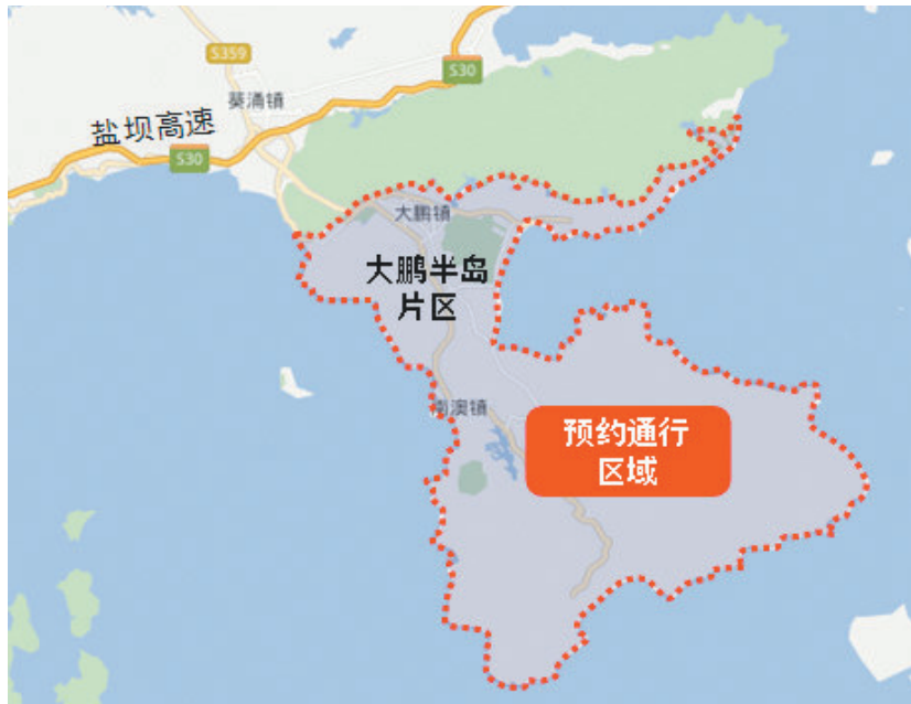
大鹏片区预约通行区域

在深圳,有一个神奇的地方,每到节假日,大家全扎堆往那儿去,对于许多深圳及周边城市的人来说,那是每个夏天必须打卡的地方——深圳东部。