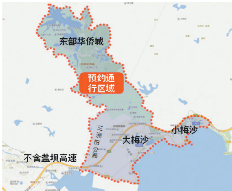
梅沙片区预约通行区域