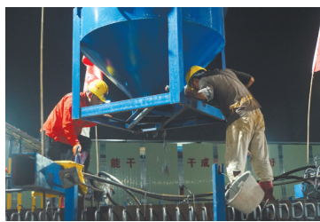
项目施工中

为保证贝涌梁厂首片梁顺利浇筑，中铁大桥局莞番高速8A标项目部做了大量工作，从预制梁厂建设开始，项目部主要领导每天都亲临现场进行巡视指导；工区经理、项目技术、机械、安全负责人从模板安装检查、钢筋制作绑扎、原材检验检测、机械设备调试等各个环节，进行了严格的把控；从模板验收、钢筋